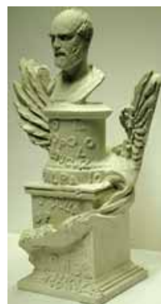
Il bozzetto di Pierantonio Volpini

il tipico monumento celebrativo: il busto di Mazzini, ritratto come un antico filosofo, è posto su un basamento molto classico dove si potranno leggere parole celebri del patriota. La sua particolarità è che le lettere che compongono l'iscrizione sono disposte in maniera disordinata, alcune finiscono addirittura sul pavimento, così che il visitatore o il semplice passante è invogliato ad avvicinarsi all'opera per riuscire a leggerla, uno sforzo che simboleg-