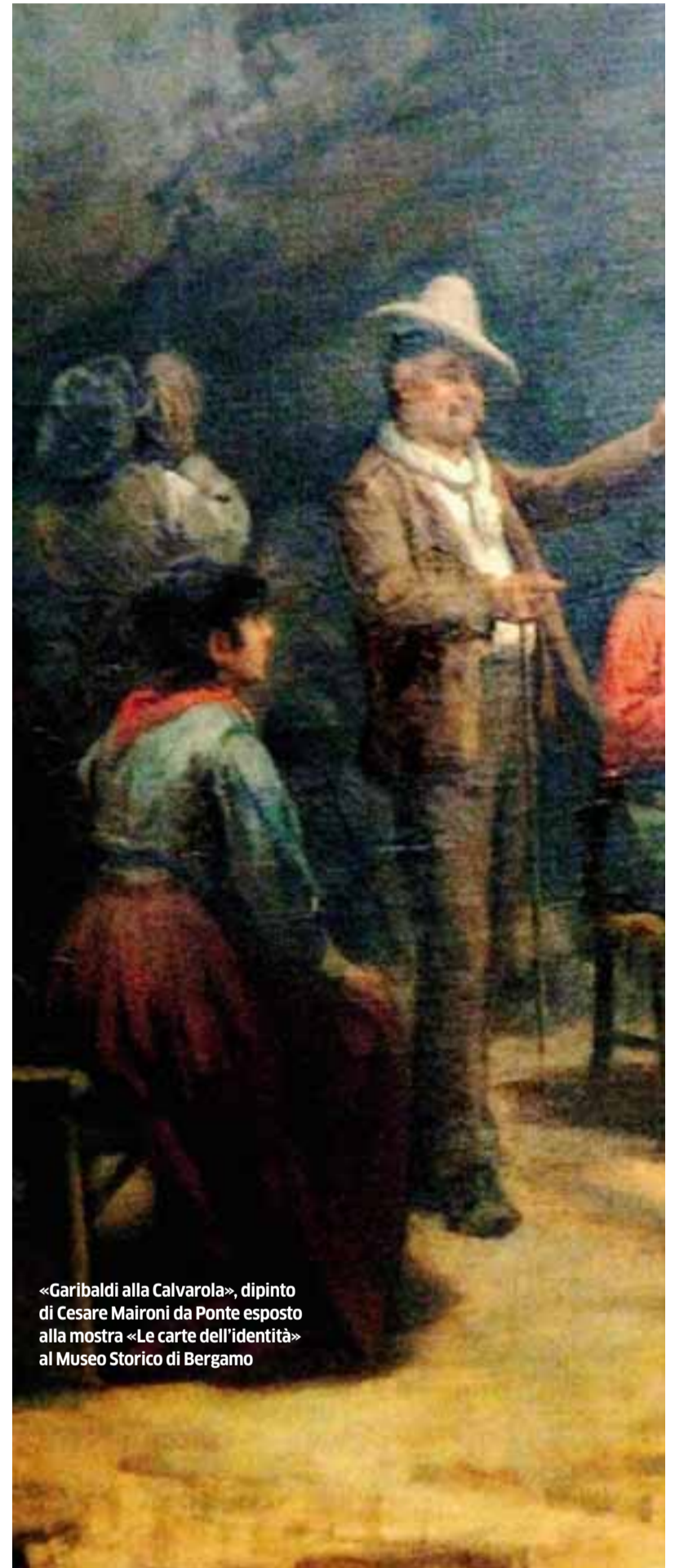
«Garibaldi alla Calvarola», dipinto di Cesare Maironi da Ponte esposto alla mostra «Le carte dell'identità» al Museo Storico di Bergamo