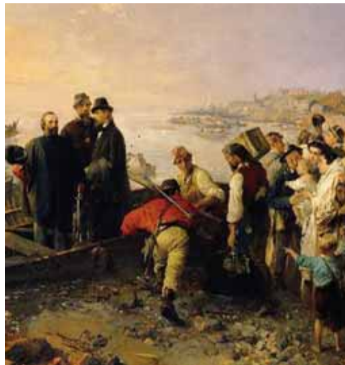
«L'imbarco dei Mille a Quarto» di Gerolamo Induno (particolare)